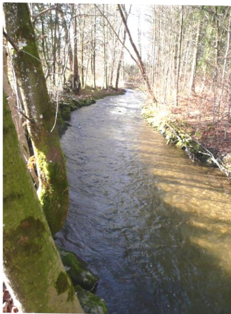
Schlierach vor Miesbach