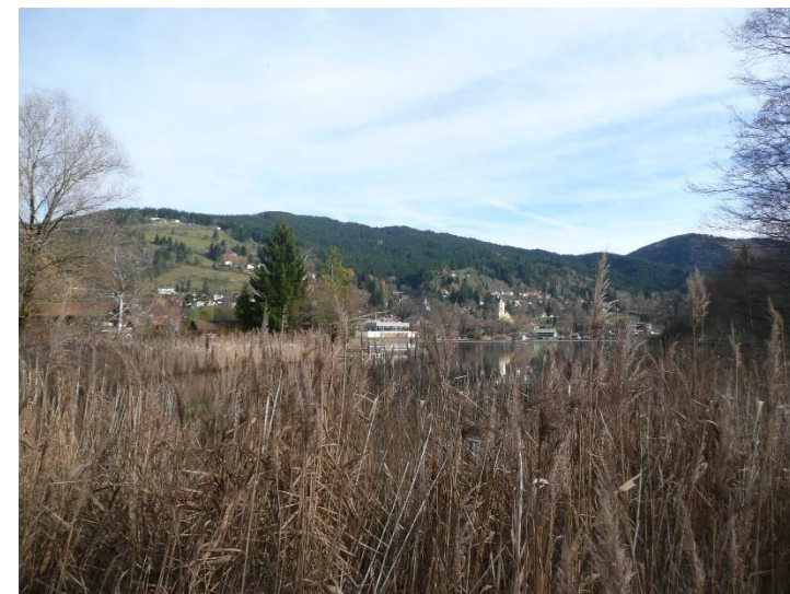
Schlierach- Ausfluss Schliersee