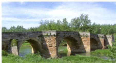
Brücke bei Burgos