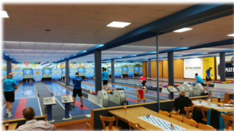
Ulrich Griebel, DV-Fachwart Sportkegeln