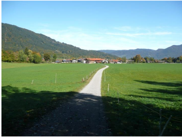
Blick auf Schärflen