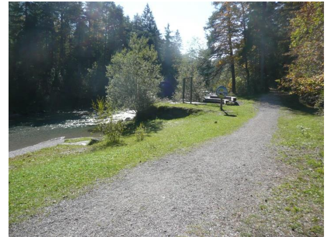
20 Leute können hier sitzen