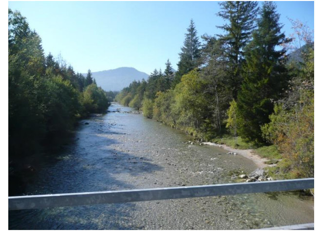
Die Weißsach stromaufwärts

09.02.2019 Durch die Gaißacher Filze 09.03.2019 Geitau-Fischbachau 13.04.2019 Sportlerwallfahrt Andechs