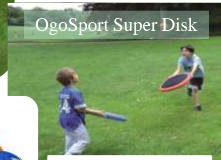
OgoSport Super Disk